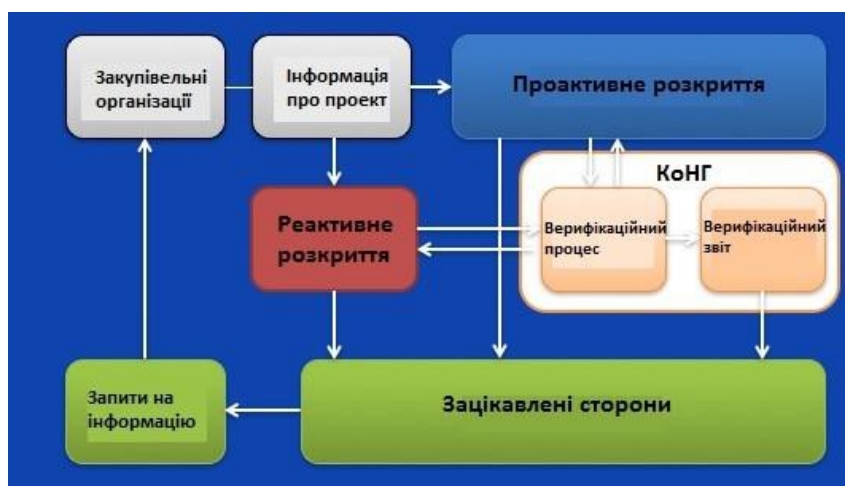
Рис. 1 - Розкриття інформації CoST і пов'язаною з ним верифікацією

«Розкриття інформації» в рамках проектів CoST, це оприлюднення об'єктивних розкритих даних наданих закупівельними організаціями, які є замовниками будівельних/ремонтних робіт. Крім того, закупівельні організації погоджуються надавати додаткову інформацію в рамках «Реактивного розкриття», включаючи технічні характеристики, звіти, загальну характеристику об'єктів та ефективність від реалізації проектів.